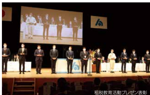
租税教育活動プレゼン表彰