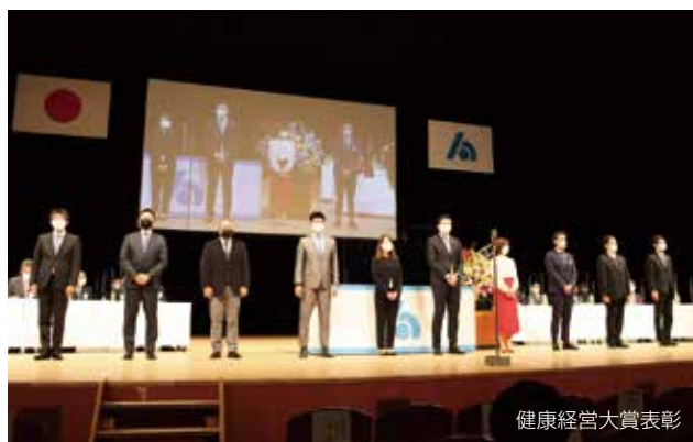
健康経営大賞表彰