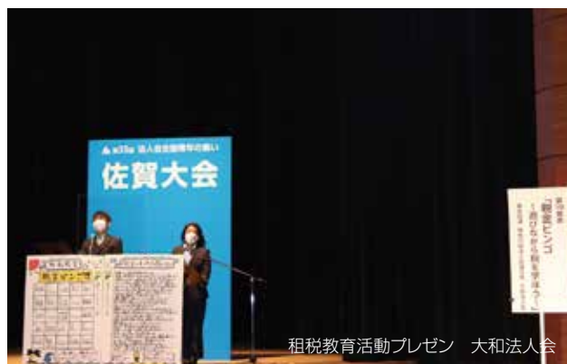
租税教育活動プレゼン 大和法人会