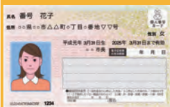
マイナンバーカード