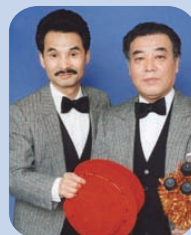
ボンボンブラザーズ