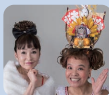
すず風 にゃん子 金魚