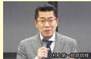
村上第一統括官様