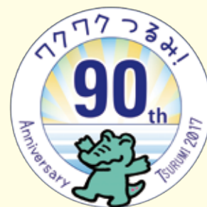
鶴見区制90周年ロゴマーク

28日(金) 一般可 ●青年部会正副部会長会議 【場 所】 法人会会議室 【時 間】 13:30～