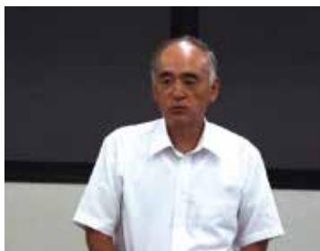
鶴見税務署長木村善晴様