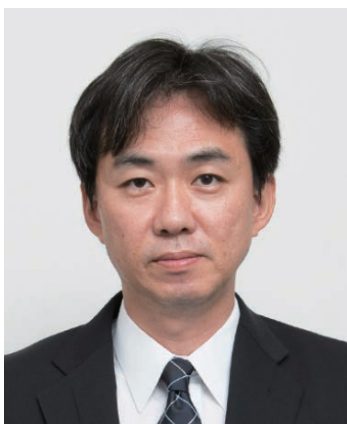
法人課税第1部門 統括国税調査官 沼澤 隆太郎

結びに当たり、公益社団法人鶴見法人会の益々のご発展と、会員の皆様方の事業のご繁栄並びにご健勝を心から祈念致しまして、私の挨拶とさせていただきます。