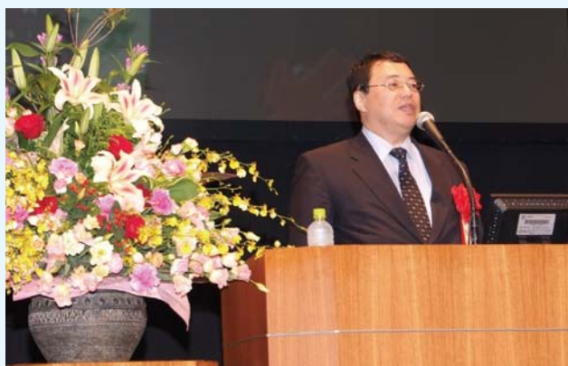
歴史家・作家 加来耕三氏