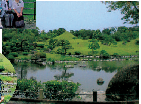
熊本・水前寺公園