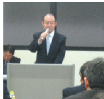
鶴見税務署長渡邊秀一様