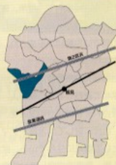
東寺尾支部/東寺尾1～6丁目

地域的に合同で開催できる会合・イベントを行うことにより会員に密着した活動を心がけています。