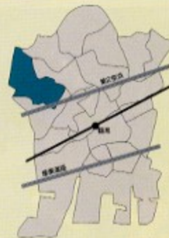
馬場上の宮支部/馬場、上の宮

二代目を含め若い人に汗をかいてもらい変遷を余儀なくされている地域に新しく興味を持つ組織にしていければと思っています。又、支部活動も年度予算を全て使い切る方向で幹事会や会員研修会を実施しております。