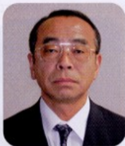
鶴見税務署長 菊地 俊寛