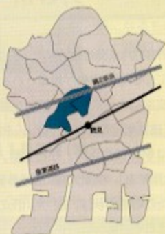
東寺尾寺谷支部/東寺尾北台、東寺尾中台、東寺尾東台、露防坂、寺谷

近隣の支部と交流を深めることにより、共通の悩みを共有し合同企画で会合・イベント等を行っています。