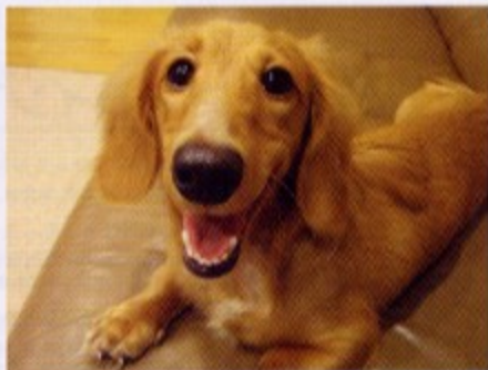
チャーリー ミニチュアダックス 投稿者:松浦企業(株)