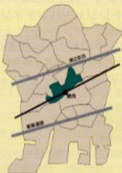
豊岡・佃野支部 / 鶴見町、豊岡町、佃野町

今回バス旅行を計画していますが予算的に厳しいので何とか役員や参加者のご負担を少なく出来るよう努力しています。税務相談なども含め異業種交流ができる会合を行い、幹事を増やすことで新会員の加入を増やす事を計画しています。