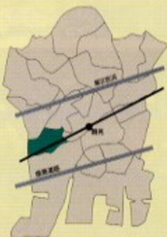
岸谷支部 / 岸谷

当支部全幹事全員一丸となって、支部幹事会などを通して支部地域の活性化を進めていきたいと考えております。幹事数の増員も考えております。