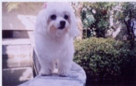
ハナ 14才 マルチーズ メス 投稿者:磯田電材(株)

今回を持ちまして「みなさんからの投稿写真」は終了とさせていただきます。今後も会員の皆様がより楽しめて役に立つ企画をご提供して参ります。なお、広報誌「ホットライン」にご意見などございましたら、事務局までご連絡ください。