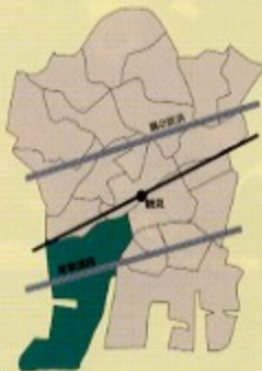
生麦支部 / 生麦、大黒町、大黒ふ頭

地域に密着した支部活動を通じて、新規会員を増やす努力並びに会員の皆様に、異業種交流等により情報交換の魅力を各種事業を通じて、ご理解いただけるよう努力しています。