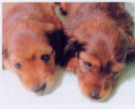
向かって写真左 オス サムくん、右 メス マリンちゃん

初めて生まれた2匹です。マリンちゃんは「さかご」で、サムくんはボンと生まれました。今は元気に走り回っています。もうすぐサムくんはパパの家に行ってしまう。淋しいです。ママはブラックタンですが、子供達はレッドです。顔は二匹とも似ていません。おっとり顔のサムくんとおてんばそうなマリンちゃんです。