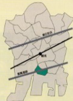
本町南支部/本町4丁目、 下野谷町4丁目、仲町1丁目、 汐入1丁目~2丁目、小野町

現況を見直す為にも、この秋に所属ブロックで懇親会を行い会員が興味をもてる組織作りを企画しています。