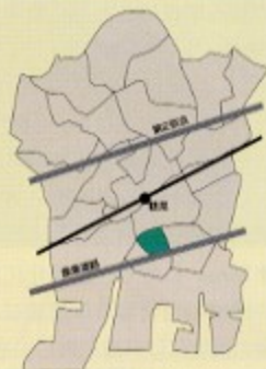
本町西支部/ 本町通り1丁目~3丁目、 下野谷町1丁目~3丁目

明るく楽しい(会費を払って良かったと思って頂く)会にする事で新規会員を増やす努力をしています。また他の支部の情報などを知る事で充実した支部になるよう心がけています。