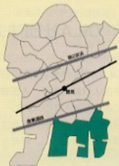
瀬田東支部/朝日町、安善町、原島、寛政町、末広町、大栄町、井天町

活動費の減少などで個々の持ち出しも増えていることから、幹事会でも皆様に異業種交流など情報交換の魅力をご理解頂けるよう努力しています。