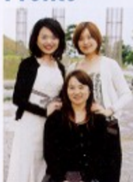
撮影場所:大黒心頭 海づり公園