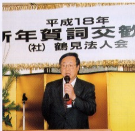
杉山税理士会支部長