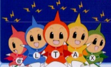
イメージキャラクター エルレンジャー

「eLTAX(エルタックス)」は、地方公共団体が共同で運営する 地方税の総合窓口システムです。