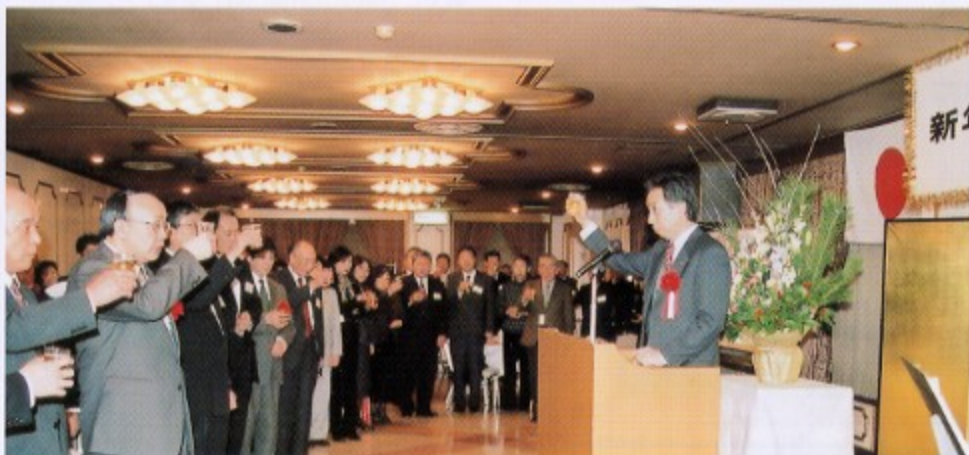
乾杯あいさつ：織茂県税事務所長